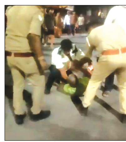
मारपीट करते हुए पुलिस व चालक

चित्रकूट। सोमवती अमावस्या मेले में लाखों श्रद्धालुओं की आस्था और व्यवस्था सभालने में जुटी पुलिस उस समय खुद सवालियों के घेरे में आ गई, जब चित्रकूट के स्टेशन रोड पर एक ट्रैफिक सिपाही और बस चालक के बीच बीच सड़क पर मारपीट का वीडियो सोशल मीडिया पर वायरल हो गया। शहर कोतवाली कर्वी क्षेत्र स्थित पेट्रोल पंप के पास हुई इस घटना ने मेले की व्यवस्थाओं पर भी बहस छेड़ दी है। प्रत्यक्षदर्शियों के अनुसार, अमावस्या मेले के कारण स्टेशन रोड पर भारी जाम की स्थिति थी। इसी दौरान ट्रैफिक ड्यूटी पर तैनात कांस्टेबल ने एक बस चालक को वाहन आगे बढ़ाने और रास्ता खाली करने