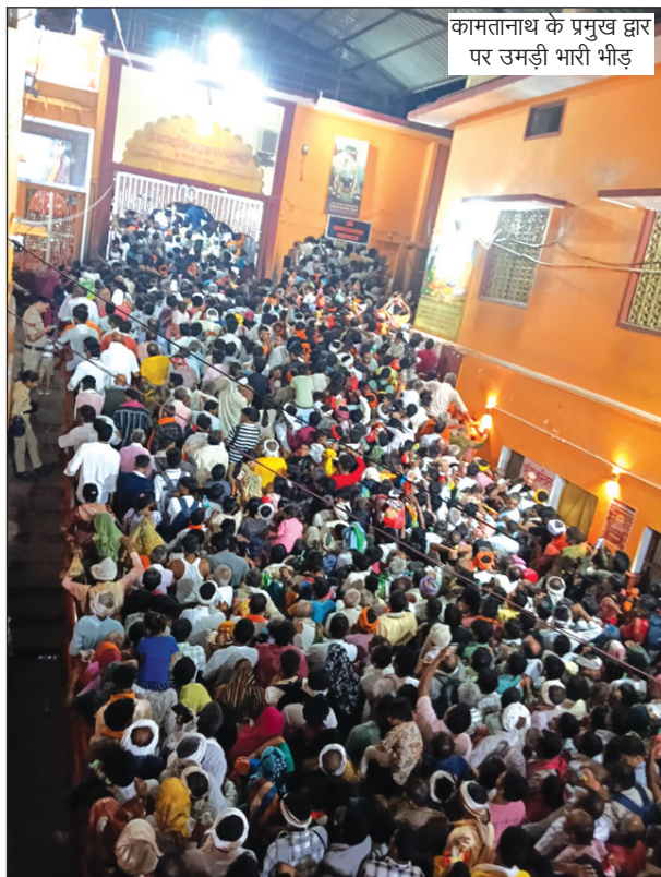
कामतानाथ के प्रमुख द्वार पर उमड़ी भारी भीड़

की परिक्रमा लगाकर परिवार की सुख-समृद्धि और मंगल की कामना की। पूरे दिन धार्मिक उत्साह और भक्ति का वातावरण बना रहा। दूसरी ओर, विशाल भीड़ को देखते हुए प्रशासन ने सुरक्षा और यातायात की व्यापक व्यवस्थाएं लागू की थीं। रामघाट, परिक्रमा मार्ग, प्रमुख चौराहों और संवेदनशील स्थलों पर पुलिस बल तैनात रहा। बैरिकेडिंग, पैदल मार्ग और यातायात डायवर्जन के जरिए भीड़ को सुव्यवस्थित रखा गया। पुलिस अधिकारी लगातार व्यवस्थाओं की निगरानी करते रहे। स्वास्थ्य, पेयजल और अन्य मूलभूत सुविधाओं की उपलब्धता से दूर-दराज से आए श्रद्धालुओं को राहत मिली। बेहतर प्रशासनिक तैयारियों के चलते लाखों श्रद्धालुओं का स्नान, दर्शन और परिक्रमा कार्यक्रम शांतिपूर्ण एवं सुचारु रूप से संपन्न हुआ।