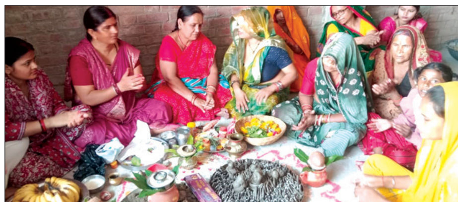
कार्यक्रम में मौजूद महिलाएं

चित्रकूट। जहां आधुनिकता की दौड़ में गांवों की परंपराएं धीरे-धीरे घुंघली पड़ती जा रही हैं, वहीं ग्राम इटौर की महिलाओं ने सोमवती अमावस्या के पावन अवसर पर संस्कृति, प्रकृति और सामाजिक चेतना का ऐसा संगम प्रस्तुत किया जिसने पूरे क्षेत्र का ध्यान आकर्षित किया। ग्राम पंचायत इटौर स्थित स्वावलंबन केन्द्र में दीनदयाल शोध संस्थान के समाज शिल्पी दंपति