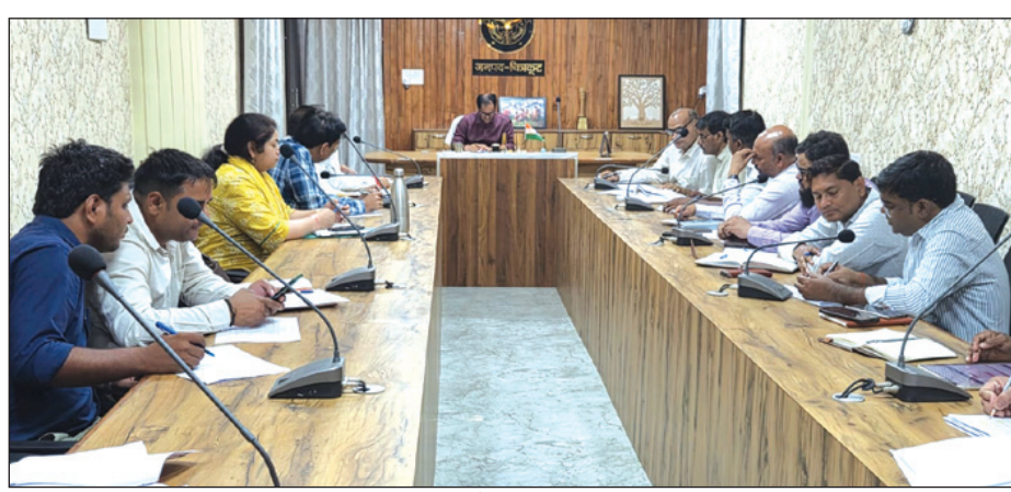
बैठक में मौजूद अधिकारीगण

चित्रकूट। मुख्यमंत्री डैशबोर्ड पर विकास कार्यों की रैंकिंग में जनपद के कई विभागों के पिछड़ने पर जिलाधिकारी पुलाकित गर्ग का सख्त रुख देखने को मिला। कैप कार्यालय में आयोजित समीक्षा बैठक के दौरान डीएम ने उन विभागों के अधिकारियों को स्पष्ट संदेश दिया कि अब केवल आश्वासन नहीं, बल्कि धरातल पर परिणाम दिखाई देने चाहिए। मुख्यमंत्री आवास योजना में जनपद की रैंकिंग सी श्रेणी में पहुंचने पर जिलाधिकारी ने परियोजना निदेशक एवं संबंधित पटल सहायक को प्रतिकूल प्रविष्टि देने के निर्देश जारी कर दिए। उन्होंने दो टूक कहा कि यदि इस माह भी