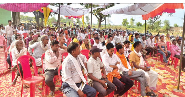
अखंड भारत संदेश

कुंडा। विकासखंड बिहार के ग्राम पंचायत रामपुर कोटा में किसानों को जागरूक करने के लिए पान सीट्स प्राइवेट लिमिटेड कोलकाता द्वारा एक गोष्ठी की गई। जिसमें सैकड़ों किसानों ने भाग लिया। जिसमें किसानों को किस प्रकार से खेती करना है किस-किस चीज का उपयोग करना है जिससे किसानों को फायदा हो सके हो