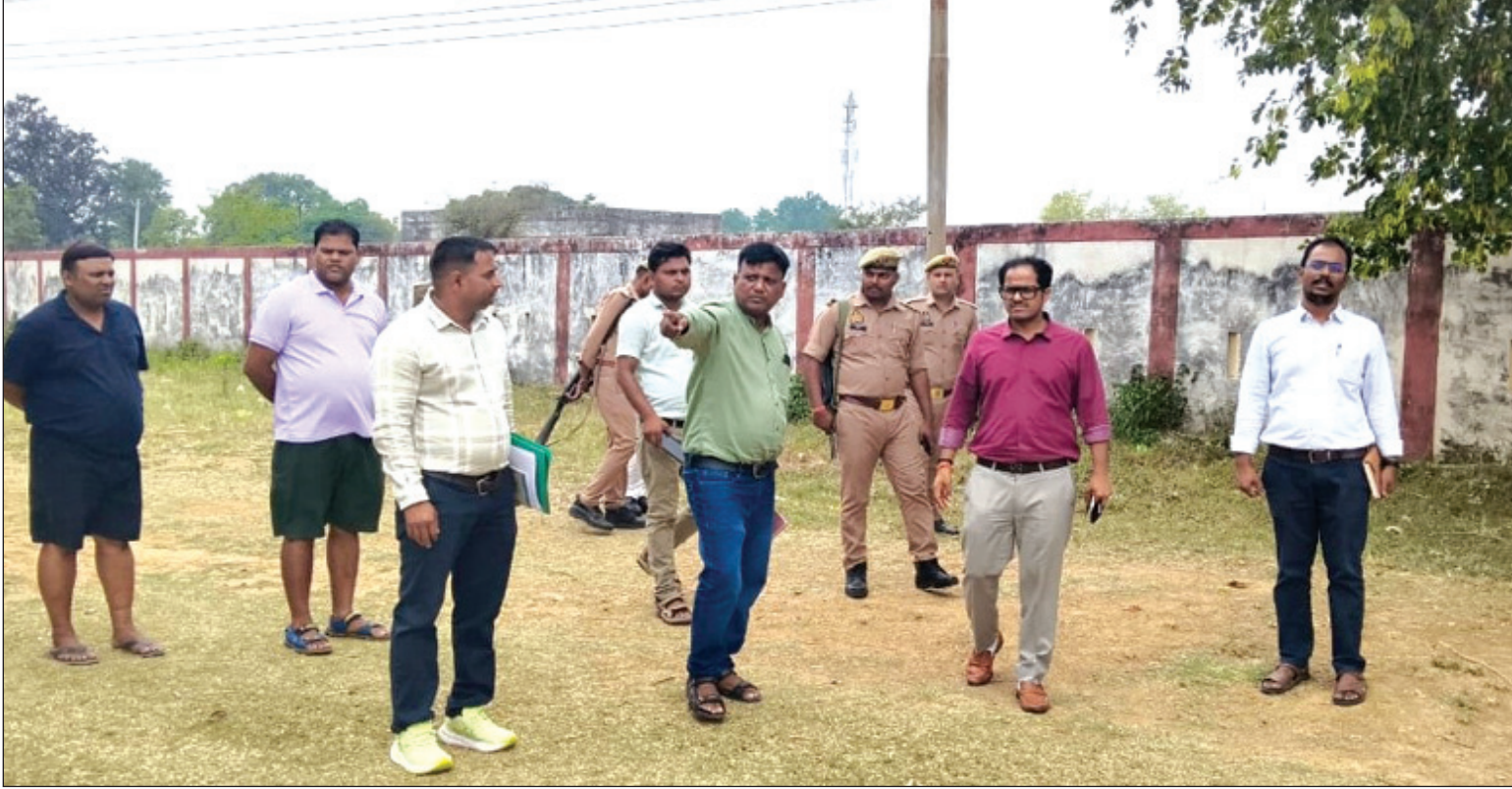
सुविधाएं विकसित होने से खिलाड़ियों को बेहतर प्रशिक्षण

और प्रदर्शन का अवसर मिलेगा। इससे आकांक्षी जनपद चित्रकूट