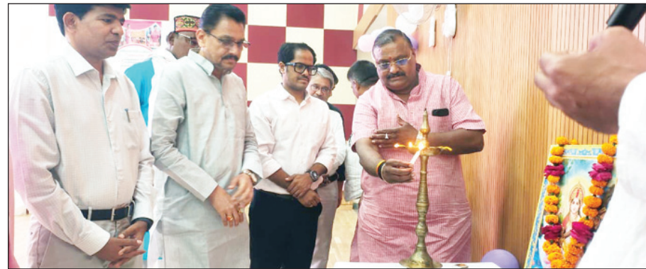
योजना पर दीप प्रज्वलित करते अधिकारीगण

अखंड भारत संदेश चित्रकूट। उत्तर प्रदेश की सरकार ने संवेदनाओं को योजनाओं में ढालते हुए मुख्यमंत्री बाल सेवा योजना (सामान्य) के जरिए उन नहीं जिनकी माता की सहायता देने का बीड़ा उठाया है, जिनके सिर से माता-पिता या अभिभावक का साया उठ चुका है। यह महज एक योजना नहीं, बल्कि टूटते सपनों को फिर से