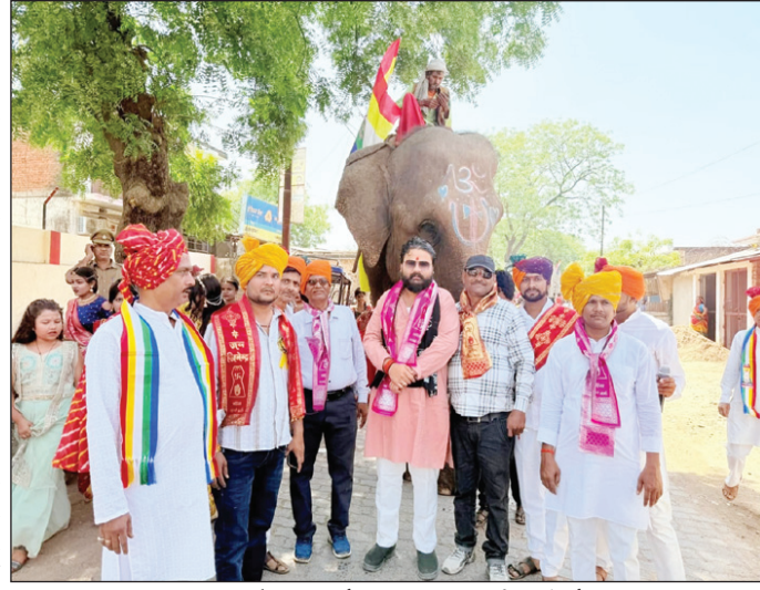
महावीर जयंती पर शोभायात्रा और सांस्कृतिक कार्यक्रम में मौजूद श्रद्धालु

बरगढ़/चित्रकूट। क्षेत्र में सोमवार को जैन समाज की आस्था और उल्लास का अद्भुत संगम देखने को मिला, जब भगवान महावीर स्वामी का जन्म कल्याणक महापर्व पूरे श्रद्धा भाव से मनाया गया। श्री कुशुनाथ दिगंबर जैन मंदिर, बरगढ़ बाजार में प्रातःकालीन अभिषेक, शांतिधारा और दीप प्रचलन के साथ पूजा-अर्चना संपन्न हुई। जियो और जीने दो के संदेश को आत्मसात करते हुए श्रद्धालुओं ने भव्य शोभायात्रा निकाली, जो नगर के प्रमुख मार्गों से होते हुए रेलवे स्टेशन तक पहुंची। बैंड-बाजा और डोजे की धुनों पर श्रद्धालु झुमें नजर आए, वहीं हाथी-घोड़े और आकर्षक झांकियों लोगों के लिए