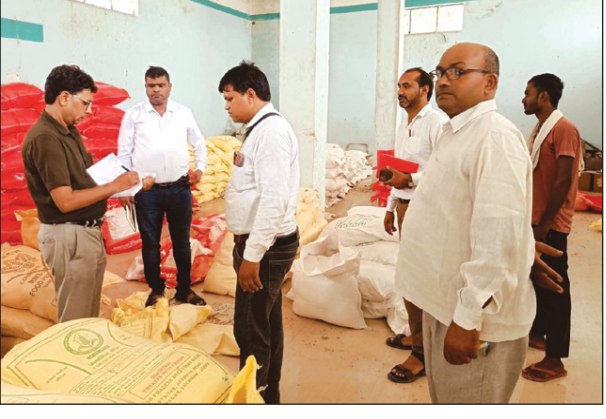
कृषि निदेशक ने किसानों को निःशुल्क बीज मिनीकिट वितरित किया।

उप कृषि निदेशक ने सबसे पहले राजकीय कृषि बीज भंडार, पहाड़ी का निरीक्षण किया। वहां मौजूद 10 किसानों को उन्होंने अरहर, बाजरा, ज्वार और तिल के निःशुल्क बीज मिनीकिट प्रदान किए। इसके बाद उन्होंने साधन सहकारी समिति लोहाद का जायजा लिया। वहां सचिव को निर्देश दिए कि किसानों को निर्धारित दर पर पूरी पारदर्शिता के साथ उर्वरक