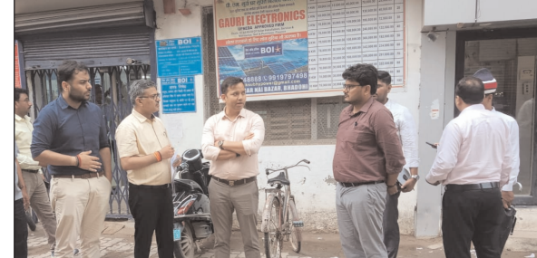
विक्रय विलेख का निरीक्षण किया। यह अकृषक भूमि जीटी रोड पर स्थित है, जिसका पंजीयन 17 जून 2026 को कराया गया था। मौके पर भूमि की स्थिति, चारदीवारी और आसपास की व्यावसायिक गतिविधियों का निरीक्षण करने के बाद

अखंड भारत संदेश भदोही। जिले में स्टॉप शुल्क और संपत्तियों के सही मूल्यांकन की जांच के लिए जिलाधिकारी शैलेष कुमार ने चार बड़े विक्रय विलेखों का स्थलीय निरीक्षण किया। जांच के दौरान ज्ञानपुर और भदोही तहसील में पंजीकृत सभी चारों बैनामों का मूल्यांकन शासन की निर्धारित दरों के अनुरूप सही पाया गया। जिलाधिकारी ने कहा कि राजस्व की क्षति रोकने और स्टॉप एवं पंजीयन व्यवस्था में पारदर्शिता बनाए रखने के लिए बड़े मूल्य के विक्रय विलेखों का नियमित सत्यापन कराया जा रहा है। जिलाधिकारी ने सबसे पहले तहसील ज्ञानपुर के मौजा जौहरपुर स्थित एक