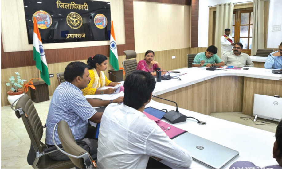
आश्रम डिग्री कॉलेज, यूनाइटेड विश्वविद्यालय और जिला विद्यालय निरीक्षक कार्यालय से निर्धारित लक्ष्य

बैठक में मुख्य विकास अधिकारी ने जिले के प्रमुख महाविद्यालयों और संबन्धित विभागों को 'मेरा युवा भारत' पोर्टल पर अधिक से अधिक युवाओं का पंजीकरण कराने के लक्ष्य दिए। उन्होंने एएसए खन्ना डिग्री कॉलेज, सीएमपी डिग्री कॉलेज, कुलभास्कर