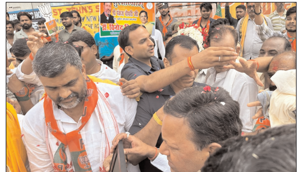
ने कहा कि प्रदेश अध्यक्ष का भदोही आगमन कार्यकर्ताओं के लिए उत्साह और प्रेरणा का अवसर है। उन्होंने कहा कि प्रधानमंत्री नरेंद्र मोदी और मुख्यमंत्री योगी आदित्यनाथ के नेतृत्व में भाजपा सरकार विकास, सुशासन और जनकल्याण के संकल्प के साथ कार्य कर रही है। प्रदेश अध्यक्ष के नेतृत्व में संगठन को और मजबूती मिलेगी तथा कार्यकर्ताओं को नई