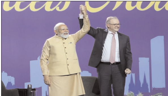
12 सालों में यह ऑस्ट्रेलिया का तीसरा दौरा

उन्होंने कहा, 'मैं अपने दोस्त और भारत के दोस्त प्रधानमंत्री पंथनी अल्बानसे का भी बहुत शुक्रगुजार हूँ। आप सिडनी में हमारे साथ थे, और आज आप यहां मेलबर्न में भी भारतीय समुदाय के साथ शामिल हुए हैं। एक तरह से, चीजें पूरी तरह से बदल गई हैं। अहमदाबाद, जो दुनिया के सबसे बड़े क्रिकेट स्टेडियम का घर है, से लेकर मेलबर्न, जहां इसका मशहूर स्टेडियम है। हम दोनों जगहों पर साथ रहे हैं। हम सबने देखा है कि प्रधानमंत्री जब भी बोलते हैं तो भारतीयों के दिल और दिमाग पर कैसे छा जाते हैं। आपने सिडनी में जबरदस्त असर डाला, और आपने यहां भी सभी को मंत्रमुग्ध कर दिया