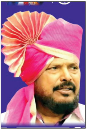
केंद्रीय मंत्री डॉ रामदास आठवले