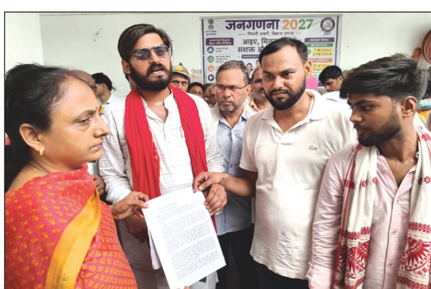
गांव का सार्वजनिक रास्ता अवरुद्ध होने से एसडीएम मेजा को ज्ञापन सौंपते आक्रोशित ग्रामीण

ग्रामीण अरसा पूर्व से करते आ रहे हैं। यह मार्ग ग्रामवासियों के आवागमन के साथ-साथ क्षेत्र के प्राचीन धार्मिक एवं आस्था के केंद्र सिद्ध शिव बहारा पीठ तक पहुंचने का प्रमुख रास्ता भी रहा है किंतु वर्तमान में विनोद कुमार मित्तल नामक कंपनी द्वारा उक्त सार्वजनिक मार्ग को अवरुद्ध कर दिया गया है, जिससे ग्रामवासियों, श्रद्धालुओं एवं किसानों को आवागमन में जहां भारी समस्याओं का सामना करना पड़ रहा है वहीं इससे लोगों की धार्मिक भावनाएं भी आहत हो रही हैं साथ ही साथ गांव के परंपरागत अधिकारों का हनन भी हो रहा है। ज्ञापन सौंपने वाले ग्रामीणों के अनुसार इस प्रकार में पूर्व में कई बार शिकायतें की जा चुकी हैं और राज्य सरकार की टीम द्वारा मौके पर जांच एवं पैमाइश भी कराई जा चुकी है जिसकी रिपोर्ट भी रिपोर्ट प्रस्तुत की जा चुकी है। इतना ही नहीं जन