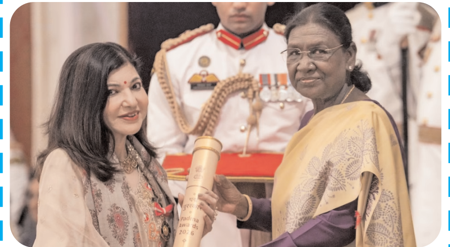
सिंगर अलका यादव को मिला पद्म भूषण, पीएम मोदी के छुए पैर, लिया आशीर्वाद