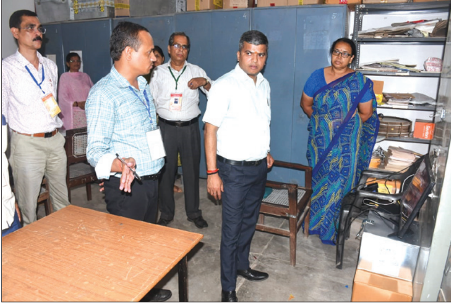
विद्या मंदिर, रामबाग सहित विभिन्न विद्यालयों में बनाये गये परीक्षा केन्द्रों का औचक निरीक्षण किया गया।

निरीक्षण के दौरान जिलाधिकारी ने केंद्र व्यवस्थापक से परीक्षा संचालन संबंधी जानकारी प्राप्त की तथा परीक्षा में तैनात कर्मिकों को निष्पक्ष एवं पारदर्शी तरीके से कार्य करने के निर्देश दिए।