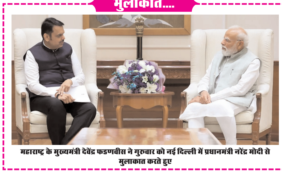
महाराष्ट्र के मुख्यमंत्री देवेद्र फडणवीस ने गुरुवार को नई दिल्ली में प्रधानमंत्री नरेंद्र मोदी से मुलाकात करते हुए

कहा, ह्यमैंने लोक भवन में राज्यपाल कार्यालय को अपना इस्तीफा दे दिया है। राज्यपाल इस वक्त शहर में नहीं हैं, वो रात में लौटने वाले हैं, इसलिए मैंने अपना इस्तीफा उनके विशेष सचिव को सौंप दिया है। जब वे वापस आएंगे तब उन्हें मेरा इस्तीफा मिल जाएगा और मुझे यकीन है कि वे लोकतांत्रिक नियमों के आधार पर मेरा इस्तीफा स्वीकार कर लेंगे। कांग्रेस के पास सरकार बनाने के लिए स्पष्ट बहुमत: सिद्धारमैया राज्य में नई सरकार के गठन को लेकर सिद्धारमैया ने कहा, ह्यमैंने अपना इस्तीफा सौंप दिया है, अब वे राज्यपाल की जिम्मेदारी है कि वे अगले मुख्यमंत्री को नई सरकार के गठन के लिए निमंत्रण दें, ह्यमैंने कहा कि कांग्रेस को दो स्वतंत्र विधायकों के साथ कुल 136 विधायकों को समर्थन प्राप्त है, जो कि विधानसभा में पार्टी को स्पष्ट बहुमत देती है।