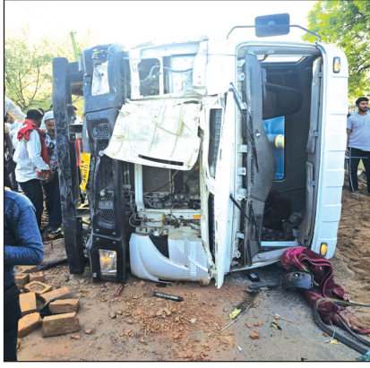
दूसरे हादसे में ई-रिक्शा सवार 4 लोगों को मौके पर ही मौत हो गई,

की ओर जा रहा था। बिसंडा कस्बे के पास ट्रक ने सबसे पहले एक साइकिल सवार रिटायर्ड शिक्षक को जोरदार टक्कर मार दी, जिससे उनकी मौके पर ही दर्दनाक मौत हो गई। शिक्षक की मौत से गुस्सा ग्रामीणों ने जब ट्रक का पीछा किया, तो पकड़े जाने के डर से ड्राइवर ने ट्रक की रफतार और बढ़ा दी। भागने के चक्कर में ट्रक ने सामने से आ रही एक सवारियों से भरी ई-रिक्शा को सोधी और जबरदस्त टक्कर मार दी। टक्कर इतनी भीषण थी कि ट्रक अनियंत्रित होकर पलट गया। ई-रिक्शा को रौंदते हुए ट्रक पलटने के कारण चोख-पुकार मच गई। इस