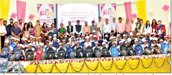
बालिका सशक्तिकरण अभियान सत्र 2026 के उद्घाटन समारोह में प्रतिभाग करती बालिकाएँ एवं उनके अभिभावक गण