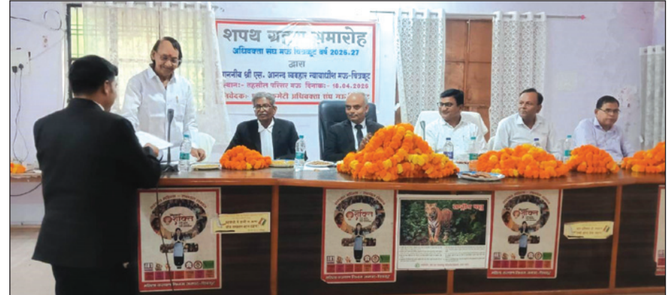
मऊ/चित्रकूट। न्यायिक अधिकारियों की मौजूदगी में शनिवार को अधिवक्ता संघ मऊ के नवनिर्वाचित पदाधिकारियों को शपथ दिलायी गई। इस दौरान आर और बेंच के बीच सामंजस्य रखने पर जोर दिया गया। मऊ तहसील सभागार में शनिवार को व्यवहार न्यायाधीश एस आनन्द, उपजिलाधिकारी रामऋषि

रमन व तहसीलदार रामसुधार की मौजूदगी में एल्डर कमेटी द्वारा तहसील अधिवक्ता संघ के नवनिर्वाचित पदाधिकारियों को शपथ दिलायी गई। इस दौरान आर और बेंच के बीच सामंजस्य रखने पर जोर दिया गया। मऊ तहसील सभागार में शनिवार को व्यवहार न्यायाधीश एस आनन्द, उपजिलाधिकारी रामऋषि