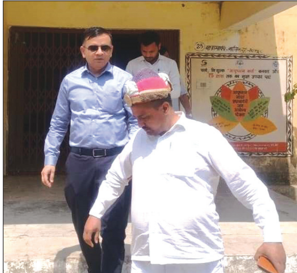
चिकित्सा अधिकारी से स्पष्टीकरण प्राप्त करने के निर्देश दिए। साथ ही निर्देशित किया गया कि स्वास्थ्य केन्द्रों पर चिकित्सकों एवं स्टाफ की नियमित उपस्थिति सुनिश्चित की जाए, मरीजों को समयबद्ध एवं गुणवत्तापूर्ण