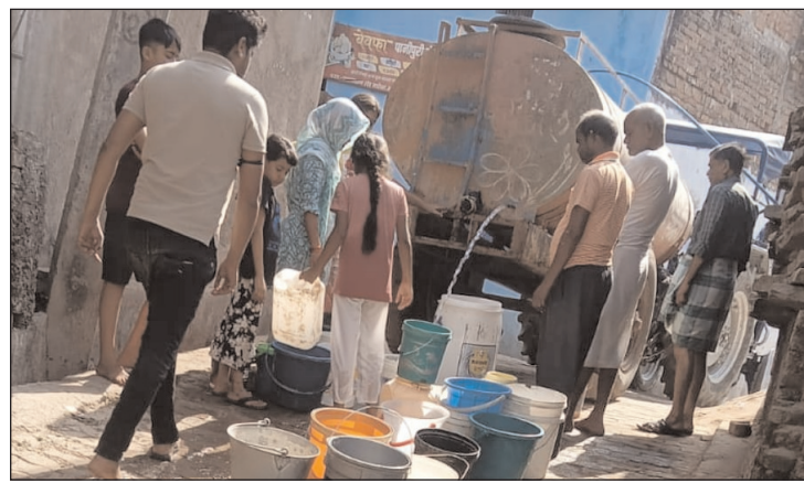
पिछले चार दिनों से जलापूर्ति पूरी तरह ठप पड़ी है, जिससे लोगों के सामने पीने के

और गंदा होने के कारण पीने योग्य नहीं बचा है। ऐसे में वर्षों पहले तत्कालीन सरकार द्वारा ग्राम तुरा में दो नलकूप स्थापित कर बंदोसा क्षेत्र के लिए पेयजल आपूर्ति शुरू कराई गई थी, जिससे लोगों को राहत मिली थी। लेकिन अब ग्रामीणों का आरोप है कि जल जीवन मिशन के अधिकारियों ने तुरा पुल के पास नमामि गंगे योजना की पाइप लाइन को जल संस्थान की मुख्य पाइप लाइन से जोड़ दिया है। इससे बंदोसा क्षेत्र के हिस्से का पानी डायवर्ट हो रहा है और नियमित जलापूर्ति प्रभावित हो गई है। ग्रामीणों ने बताया कि पहले सुबह पानी की सप्लाई होती थी, लेकिन अब दोपहर में अनियमित रूप से पानी छोड़ा जाता है।