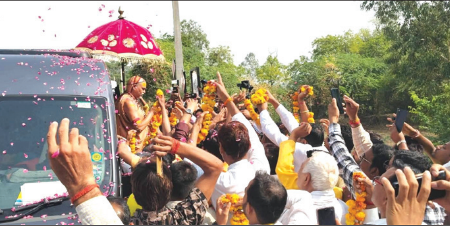
अखंड भारत संदेश

बदरिका आश्रम के शंकराचार्य ने गाय को कामधेनु के रूप में पीढ़ी को सौंपने पर दिया जोर