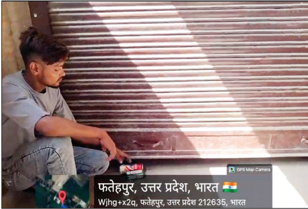
फतेहपुर, उत्तर प्रदेश, भारत Wjhg+Y2g, फतेहपुर, उत्तर प्रदेश 212635, भारत

फतेहपुर। जिले में सरकारी शराब की दुकानों पर ओवर रेटिंग का खेल खुलेआम चल रहा है। एक कंपोजिट दुकान में शटर के नीचे से सुबह से ही ओवर रेट में शराब और बीयर बेची जा रही है। 24 जून 2026 को सुबह करीब 9 बजकर 7 मिनट पर शटर के नीचे से देशी शराब और बीयर बेचने का वीडियो कैमरे में कैद हो गया। आरोप है कि वीडियो बनाने वाले युवक का सेल्समैन ने मोबाइल छीन लिया और धमकी दी कि अधिकारी उसकी जेब में हैं, कोई उधका कुछ नहीं कर सकता। स्थानीय लोगों ने वीडियो बनाने वाले युवक को बचाया। ग्रामीणों का आरोप है कि इस दुकान से 24 घंटे ओवर रेट में शराब बेची जाती है। 50 से 100 रुपये तक ज्यादा बसले जाते हैं। शराबी सुबह से नशे में आने-जाने वालों से अभद्रता करते