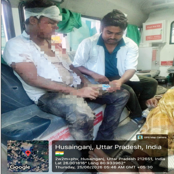
Husainganj, Uttar Pradesh, India 2w2m+phv, Husainganj, Uttar Pradesh 212651, India Lat 26.001816° Long 80.933962° Thursday, 25/06/2026 05:46 AM GMT +05:30

फतेहपुर। जिले में तेज रफ्तार का कहर थमने का नाम नहीं ले रहा है। हुसैनगंज थाना क्षेत्र के बहवलपुर गांव के पास सोमवार को एक बड़ा सड़क हादसा हो गया। प्रत्यक्षदर्शियों के मुताबिक, मोरंग से लदा एक तेज रफ्तार ट्रैक्टर ओवरटेक करने के चक्र में अनियंत्रित हो गया और सामने से आ रही पिकअप में सीधी टक्कर मार दी। टक्कर इतनी जबरदस्त थी कि पिकअप का अगला हिस्सा बुरी तरह क्षतिग्रस्त हो गया और मौके पर चीख-पुकार मच गई। हादसे में पिकअप में सवार एक महिला समेत दो लोग गंभीर रूप से घायल हो गए। स्थानीय लोगों ने