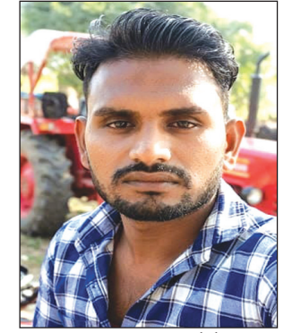
मृतक की फाइल फोटो