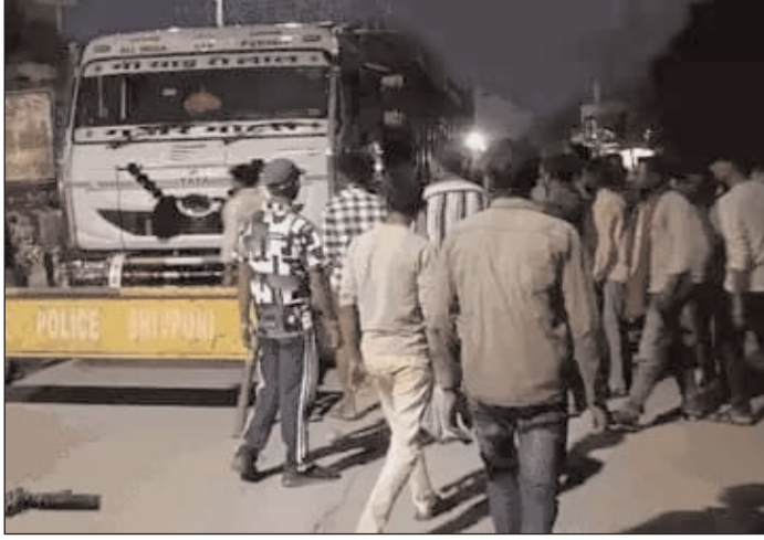
हत्या के बाद भड़का आक्रोश, सड़क पर लगाया जाम