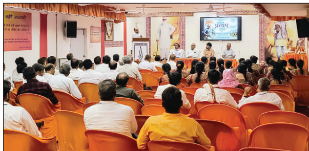
जयंती में मौजूद डीआरआई कार्यक्रमों