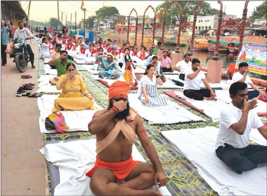
रामघाट में योग करते हुए नागरिक