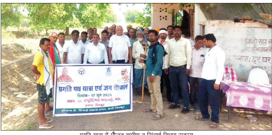
प्रगति यात्रा में मौजूद ग्रामीण व सिंचाई विभाग सदस्य

जल प्रबंधन से जुड़े विभिन्न विषयों पर विस्तार से जानकारी दी। जनचौपाल में किसानों को विभाग द्वारा विगत वर्षों में कराए गए कार्यों के साथ-साथ आगामी योजनाओं एवं नहरों के सुगम संचालन हेतु तैयार कार्ययोजना से भी अवगत