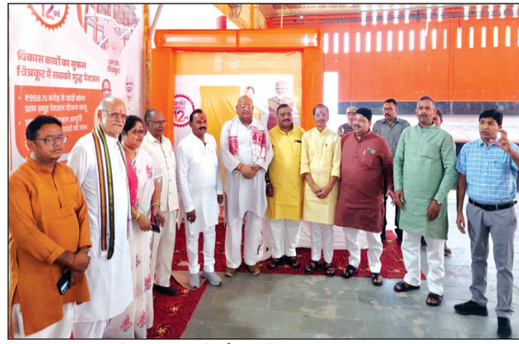
मेला परिसर में मौजूद नेता जी व अधिकारीगण