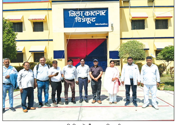
स्वास्थ्य शिविर में मौजूद अधिकारीगण

चित्रकूट। जिले की बंद सलाखों के पीछे विश्व स्वास्थ्य दिवस पर इंसानियत की एक नई रोशनी जगमगाईए जब मुख्य चिकित्सा अधिकारी के निर्देश पर जिला कारागार रंगौली में स्वास्थ्य शिविर का आयोजन हुआ। जहां आमतौर पर सन्नाटा और सख्ती हावी रहती है वहीं आज डॉक्टरों की टीम ने कैदियों के दर्द को सुना और उन्हें राहत दी। 98 कैदियों की विशेषज्ञों द्वारा जांच कर दवाइयां वितरित की गईं किसी की आंखों में धुंध थीए तो कोई मानसिक तनाव से जुड़ा रहा थाए तो कोई हड्डियों के दर्द से कराह रहा था। 12 दिव्यांग कैदियों की पहचान कर