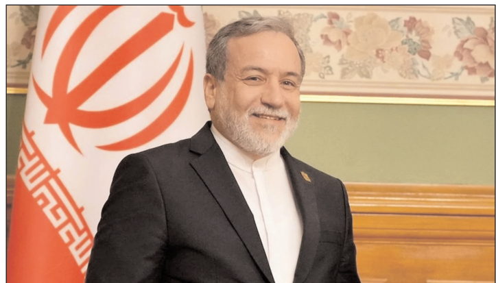
मंत्री इशाक डार से फोन पर विस्तृत चर्चा की। पाकिस्तान के विदेश मंत्रालय के अनुसार, दोनों नेताओं ने क्षेत्रीय हालात पर विचार-विमर्श किया और भविष्य में भी संपर्क बनाए रखने पर सहमति जताई। इशाक डार ने दोहराया कि समस्याओं का

ईरान ईरान और अमेरिका के बीच बढ़ते तनाव के बीच कूटनीतिक हलचल तेज हो गई है। इस दौरान ईरान के विदेश मंत्री सैयद अब्बास अराघची ने इस्लामाबाद में बातचीत से इनकार की खबरों को सिरे से खारिज कर दिया है और पाकिस्तान द्वारा किए जा रहे शांति प्रयासों की सराहना की है। सैयद अब्बास अराघची ने उन मीडिया रिपोर्ट्स का खंडन किया, जिनमें दावा किया गया था कि ईरान अमेरिका के साथ बातचीत के लिए इस्लामाबाद जाने को तैयार नहीं है। उन्होंने स्पष्ट किया कि तेहरान का रुख बातचीत की शर्तों पर निर्भर करेगा। इसी सिलसिले में शनिवार देर रात अराघची ने पाकिस्तान के विदेश