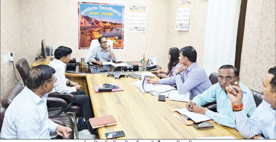
फार्मर रजिस्ट्री की समीक्षा बैठक में मौजूद अधिकारीगण