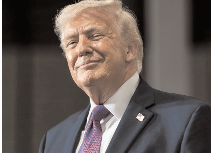
अमेरिका अपने किसी भी सैनिक को पीछे किसी भी अमेरिकी सैनिक को कोई नहीं छोड़ेगा। इस पूरे मिशन के दौरान नुकसान नहीं पहुंचा है और अमेरिका ने

दुश्मन के इलाके में कैसे चला ऑपरेशन? ट्रंप के अनुसार, अमेरिकी पायलट ईरान के खतरनाक पहाड़ों में दुश्मन की सीमा के पीछे फंसा हुआ था और ईरानी सैनिक लगातार उसका पीछा कर रहे थे। राष्ट्रपति ने बताया कि वह पायलट वहां अकेला नहीं था, कमांडर-इन-चीफ, युद्ध सचिव और जॉइंट चीफ्स ऑफ स्टॉफ के चेयरमैन चौबीसों घंटे उसकी लोकेशन पर नजर रख रहे थे। ट्रंप के निर्देश पर दर्जनों घातक विमानों को रेस्क्यू के लिए भेजा गया। पायलट को कुछ चोटें आई हैं, लेकिन वह जल्द स्वस्थ हो जाएगा। सैन्य इतिहास की पहली अनोखी उपलब्धि राष्ट्रपति ट्रंप ने इस मिशन को 'चमत्कारी' बताया। उन्होंने कहा कि सैन्य इतिहास में यह पहली बार हुआ है जब दो पायलटों को दुश्मन के इलाके के काफी भीतर से दो अलग-अलग अभियानों में सुरक्षित निकाला गया है। उन्होंने साफ कहा कि