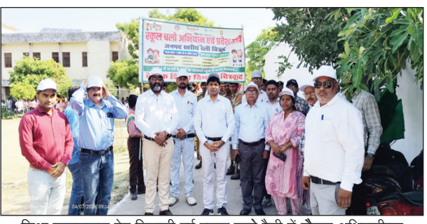
शिक्षा जागरूकता हेतु निकाली गई स्कूल चलो रैली में मौजूद अधिकारीगण