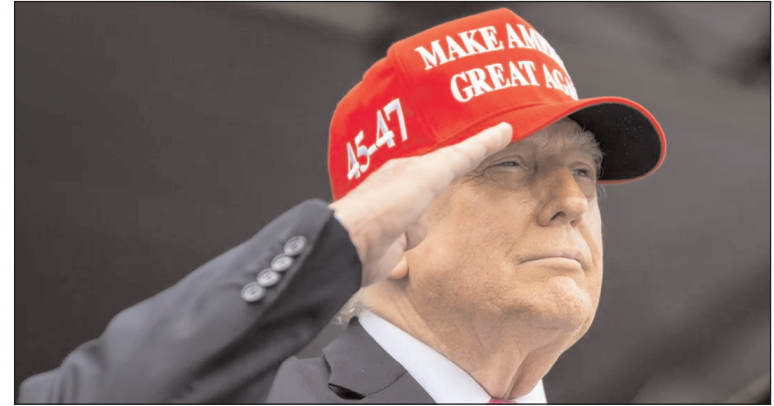
दिनभर कोई नई खबर या सार्वजनिक गतिविधि नहीं होगी, इसलिए मीडियाकर्मी अपनी ऑन-साइट कवरेज खत्म कर सकते हैं। कुछ लोगों ने इसी सामान्य विराम को बड़े संकेत मान लिया और अफवाह फैला दी।

उन्होंने अपना पूरा वीकेंड ओवल ऑफिस में कामकाज निपटाते हुए बताया है। कैसे शुरू हुआ भ्रम का सिलसिला? भ्रम को शुरूआत तब हुई जब व्हाट्सएप हाउस ने सुबह 11:08 बजे (एड) प्रेस लिड की घोषणा की। यह एक सामान्य प्रशासनिक सूचना होती है, जिसका अर्थ है कि उस दिन राष्ट्रपति का कोई और सार्वजनिक कार्यक्रम नहीं है। लेकिन एक्स पर एक बिना पुष्टि वाली पोस्ट में दावा कर दिया गया कि राष्ट्रपति अस्पताल में हैं और सड़कें बंद कर दी गई हैं। ग्लोक एआई और फेकट-चेकर्स ने तुरंत पहचान लिया कि वायरल क्लिप जुलाई 2024 की है। क्या होता है प्रेस लिड? अमेरिकी राष्ट्रपति के संदर्भ में प्रेस लिड का मतलब पत्रकारों के लिए एक संकेत होता है। इसके जरिए प्रेस ऑफिस बताता है कि अब