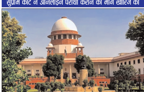
सुप्रीम कोर्ट ने आनलाइन परीक्षा कराने की मांग खारिज की