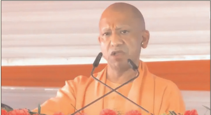
सज्जन बनें, दुर्जनों के लिए नहीं." इसके बाद उन्होंने भगवान राम का उल्लेख करते हुए कहा, "भगवान राम ने भी वही किया था. एक ही लक्ष्य था. धरती को राक्षस

छुरेबाजी. यह स्वीकार्य नहीं होगा. अगर कोई अपनी नालायक औलाद को समझ नहीं पा रहा तो समझो गलती कर रहा है. याद रखना हमारी संवेदना सामान्य नागरिकों के प्रति है." इसके साथ ही उन्होंने चेतावनी भरे अंदाज में कहा, "हम सबको ध्यान में रखना होगा अहिंसा और करुणा मानवता के भूषण हैं किंतु शस्त्र उठाना होगा अगर सामने खर दूषण है." भगवान राम और भगवान कृष्ण का किया उल्लेख सीएम योगी ने अपने संबोधन में धार्मिक उदाहरण देते हुए कहा कि भगवान कृष्ण ने भी सज्जनों की रक्षा और दुष्टों के विनाश की बात कही थी. उन्होंने कहा, "भगवान कृष्ण ने कहा था कि सज्जनों के लिए ही हम