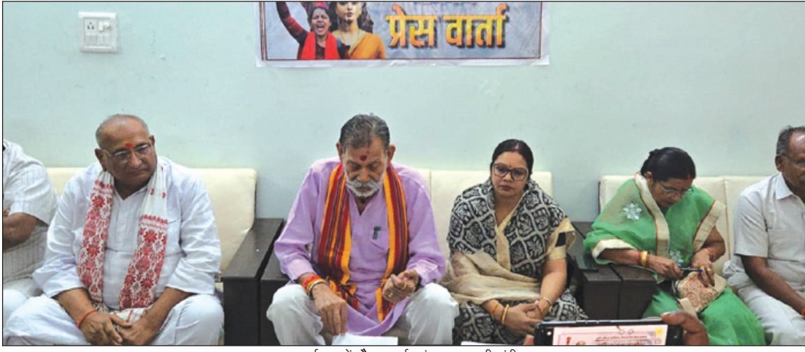
कार्यक्रम में मौजूद पूर्व सांसद व प्रभारी मंत्री