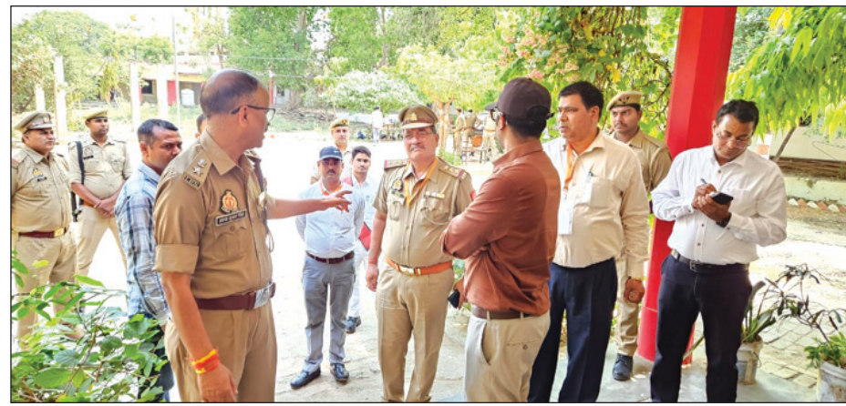
निरीक्षण करते अधिकारीगण

चित्रकूट। जनपद में होमगार्ड भर्ती परीक्षा को लेकर प्रशासन का रुख इस बार पूरी तरह नो-नॉन-सेंस नजर आया, जब जिलाधिकारी पुलकित गर्ग और पुलिस अधीक्षक ने पहाड़ी स्थित पालश्वर नाथ इंटर कॉलेज परीक्षा केंद्र पर औचक छपा मारकर व्यवस्थाओं की हकीकत टटोली। निरीक्षण के दौरान सीसीटीवी कैमरों