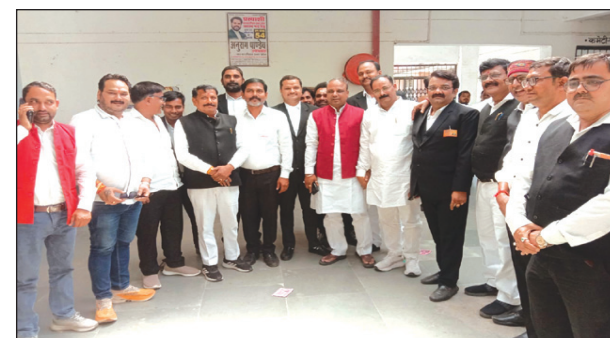
मतदान हेतु लाइन में खड़े अधिवक्ता गण

बेहद सतर्क रहे और इनकी देख रेख में व्यापक व्यवस्थाएं मतदान परिसर में की गई थी। अनुशासन और सुरक्षा व्यवस्था को लेकर बार के निर्वाचन अधिकारी श्री और फंडित मधुप दादा और भीतर एसीपी मेजा एसपी उपाध्याय एवं इंस्पेक्टर मेजा दीनदयाल सिंह ने खुद ही कमान संभाल रखी थी, दोनों जिम्मेदार अधिकारियों के कड़े आदेश पर परिसर में चप्पे चप्पे पर पुलिस की पैनी नजर रही। मतदान को लेकर दिन भर अधिवक्ताओं का भारी हजूम उमड़ा रहा। गौरतलब है कि चुनाव प्रसार के दौरान प्रत्याशियों द्वारा अधिवक्ताओं के हित मान सम्मान और सुरक्षा के प्रति अपने घोषणा पत्र में उठाए गए युद्धों के चलते पूर्व की तुलना में इस बार मेजा बार का चुनाव में प्रत्याशियों के बीच बेहद संघर्षपूर्ण