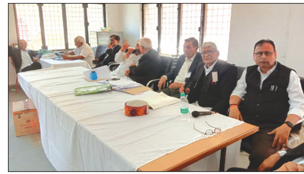
निर्वाचन अधिकारियों की निगरानी में शांतिपूर्ण ढंग से होता मेजा बार का चुनाव