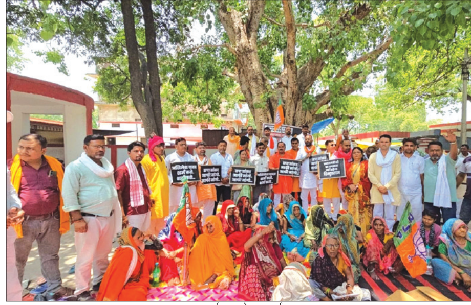
प्रदर्शन करते भाजपाई