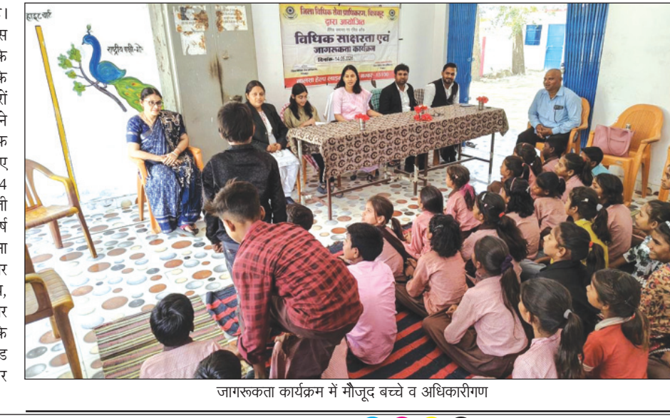
जागरूकता कार्यक्रम में मौजूद बच्चे व अधिकारीगण