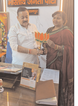
महिला कार्ड खेलकर आधी आबादी को भी साधने की रणनीति

सुल्तानपुर। विधानसभा चुनाव 2027 को लेकर भाजपा ने अभी से सियासी बिसात बिछानी शुरू कर दी है। जिले की चर्चित लंभुआ विधानसभा सीट पर इस बार भाजपा बड़ा सामाजिक और राजनीतिक समीकरण साधने की तैयारी में जुटी है। सूत्रों के मुताबिक पार्टी निषाद समाज की महिला प्रत्याशी को मैदान में उतारने के फॉर्मूलें पर गंभीर मंथन कर रही है। दरअसल, लंभुआ विधानसभा में निषाद वोटरों की संख्या काफी प्रभावशाली मानी जाती है। ऐसे में भाजपा जातीय समीकरण के साथ