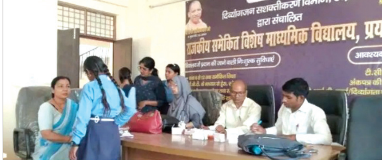
मेजा के गेदुराही में दिव्यांग छात्र छात्राओं का परीक्षण करती सीएचसी मेजा के चिकित्सकों की टीम