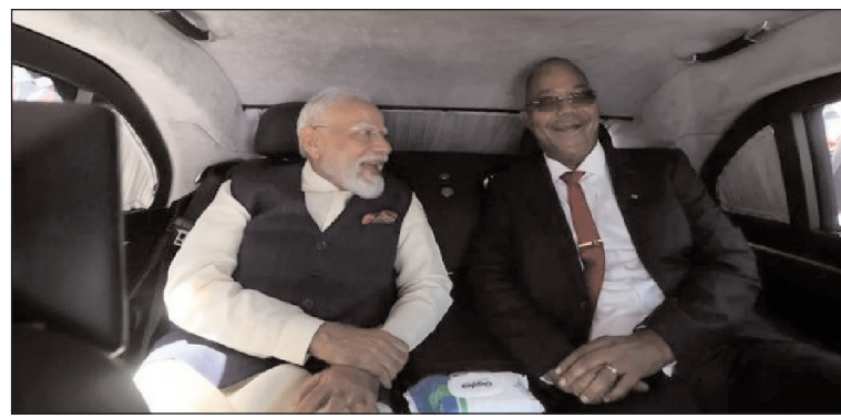
वहां रहने वाले भारतीय समुदाय के लोगों से अधिकारियों ने बताया कि समारोह में भारतीय वातचीत करेंगे। अधिकारियों ने बताया कि समारोह में भारतीय सशस्त्र बलों का एक दल और भारतीय

सेशेल्स प्रधानमंत्री नरेंद्र मोदी शनिवार को तीन दिन की सरकारी यात्रा पर सेशेल्स पहुंचे। इस यात्रा के दौरान वे राष्ट्रपति पैट्रिक हर्मिनी के साथ बातचीत करेंगे और द्वीपों से बने इस देश के 'नेशनल डे' के गोल्डन जुबली समारोह में शामिल होंगे। सेशेल्स इंटरनेशनल एयरपोर्ट पर हर्मिनी और एक उच्च-स्तरीय प्रतिनिधिमंडल ने मोदी का भव्य स्वागत किया। प्रधानमंत्री को औपचारिक 'गार्ड ऑफ ऑनर' भी दिया गया। राष्ट्रपति हर्मिनी के निमंत्रण पर राजकीय यात्रा पर गए मोदी 'गेस्ट ऑफ ऑनर' के तौर पर नेशनल डे के समारोह में शामिल होंगे। वह सेशेल्स की नेशनल असेंबली को भी संबोधित करेंगे और