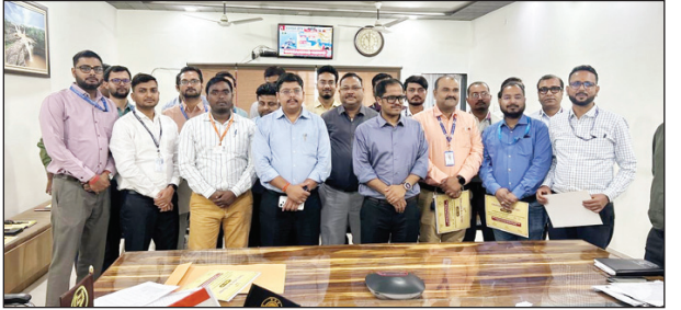
शाखा प्रबंधकों को सम्मानित करते डीएम

चित्रकूट। जिले की जमीन पर इस बार रोजगार सिर्फ नारा नहीं, एक साकार होती कहानी बनकर उभरी है। मुख्यमंत्री युवा उद्यमी योजना के अंतर्गत वित्तीय वर्ष 2025-26 में जनपद में जो प्रदर्शन किया, उसने पूरे प्रदेश में अपनी अलग पहचान गढ़ दी- प्रदेश में 8वां और मंडल में प्रथम स्थान। इस उपलब्धि पर जिलाधिकारी ने विशेष बैठक आयोजित कर उन बैंक अधिकारियों को सम्मानित किया जिन्होंने कागजी लक्ष्य को जमीनी सफलता में बदला। 1200 के लक्ष्य के मुकाबले 1232 युवाओं को योजना से जोड़ना यह साबित करता है कि इच्छाशक्ति और समन्वय ही तो सफलता की कुंजी हैं। जिलाधिकारी ने साफ कहा कि युवाओं को आत्मनिर्भर बनाना सरकार की प्राथमिकता है, और इस