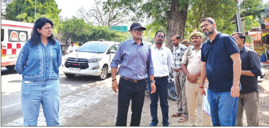
सड़क चौड़ीकरण का निरीक्षण करते डीएम

से संबंधित प्रस्तावित कार्यों की समीक्षा की। उन्होंने कार्यदायी संस्था एवं संबंधित अधिकारियों को आवश्यक औपचारिकताएं पूर्ण कर शीघ्र कार्य प्रारंभ करने के निर्देश दिए। साथ ही निर्माण कार्य में आ रही