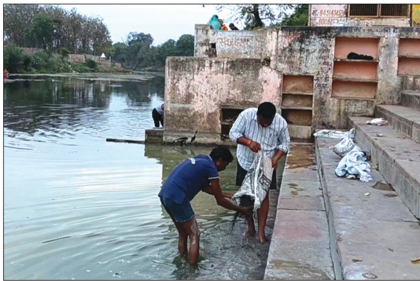
पयस्वनी घाट पर बालू डालते बुंदेली सेना