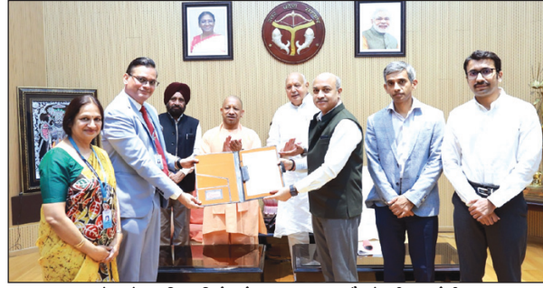
बेल के अधिकारियों को आवंटन पत्र सौंपते सीएम योगी

चित्रकूट। जिले की पावन धरा, जो अब तक पत्थर, त्याग और आस्था की पहचान रही, अब शक्ति और रणनीति की नई इबारत लिखने जा रही है। 8 अप्रैल 2026 को सीएम योगी आदित्यनाथ ने यूपी डिफेंस इंडस्ट्रियल कॉरिडोर के चित्रकूट नोड में 75 हेक्टेयर भूमि का आवंटन पत्र भारत इलेक्ट्रॉनिक लिमिटेड के अध्यक्ष मनोज जैन को सौंपकर एक ऐसे अध्याय की शुरुआत कर दी, जो बुंदेलखंड की तकदीर बदलने की ताकत रखता है। यह सिर्फ भूमि आवंटन नहीं, बल्कि आत्मनिर्भर भारत के रक्षा स्वप्न को जमीन पर उतारने की टोस पहल है। करीब 562.5 करोड़ रुपए के निवेश से यहां अत्याधुनिक रडार और वायु रक्षा प्रणालियों का निर्माण होगा, जिससे 1000 से अधिक कुशल नौकरियां