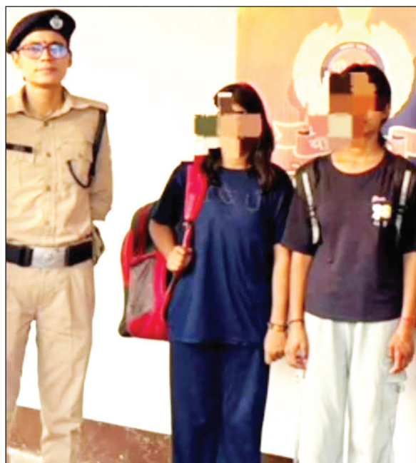
नाबालिग लड़कियों को सकुशल अग्रिम कार्रवाई एवं पुनर्वास हेतु आवश्यक सुपुर्दगी प्रक्रिया पूरी कर चाइल्डलाइन प्रयागराज को सौंप दिया गया। आरपीएफ द्वारा समग्र रहते की गई कार्रवाई से दोनों बच्चियों की सुरक्षासुनिश्चित हो सकी।