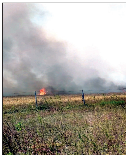
की जद्दोजहद करते नजर आए। फिलहाल अनुमान है कि इस भीषण अग्निकांड में सैकड़ों किसानों की फसल जलकर राख हो गई है, जिससे पूरे इलाके में मायूसी और चिंता का माहौल है।