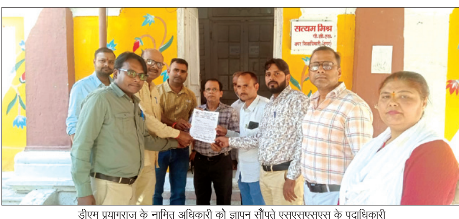
डीएम प्रयागराज के नामित अधिकारी को ज्ञापन सौंपते एसएसएसएस के पदाधिकारी