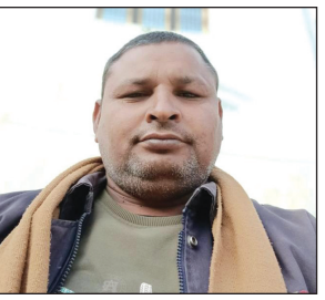
सूचना पर पहुंची पुलिस शव को कब्जे में लेकर भेजा पोस्टमार्टम