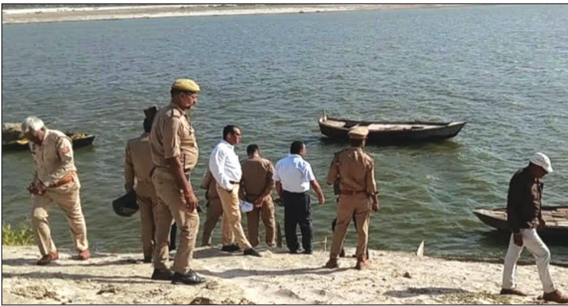
शामिल मोटरबोट, ट्रैक्टर-ट्रॉली और लोडर जब्त कर वन अधिनियमों के तहत कार्रवाई की जाएगी। उन्होंने खनन व परिवहन माफियाओं को जिले से बाहर चले जाने की चेतावनी दी। एसडीएम सदर ने कहा कि यदि वे ऐसा नहीं करते हैं और उनकी सिलिण्ट उजागर होती है, तो उन्हें स्वयं जिला बंदर की कार्रवाई के लिए तैयार रहना होगा।