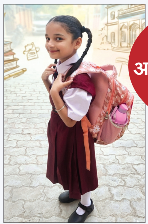
हानिकारक साबित हो सकता है। मां की चिंता स्वाभाविक है। वह अपने बच्चे को सुरक्षित और स्वस्थ देखना चाहती है, लेकिन स्कूल की अनिवार्यताओं के सामने उसकी बेबसी साफ झलकती है। वह चाहेकर भी कोई किताब या कॉपी बैग से नहीं निकाल सकती, क्योंकि हर चीज 'जरूरी' बताई जाती है। ऐसे में मां के लाडले रोजाना इस बोझ को ढोने के लिए मजबूर हैं।

अक्सर देखा जाता है कि प्राइवेट/प्राथमिक विद्यालयों की कक्षाओं के बच्चों के बैग में जरूरत से ज्यादा किताबें, कॉपीयां और अन्य सामग्री भरी होती है। स्कूलों की सख्त नियमावली, हर विषय की अलग-अलग किताबें और रोजाना का होमवर्क बच्चों के बैग को और भारी बना देता है। कई बार तो बच्चों का बैग उनके अपने वजन के अनुपात में बेहद ज्यादा होता है, जो उनके शारीरिक विकास के लिए भी